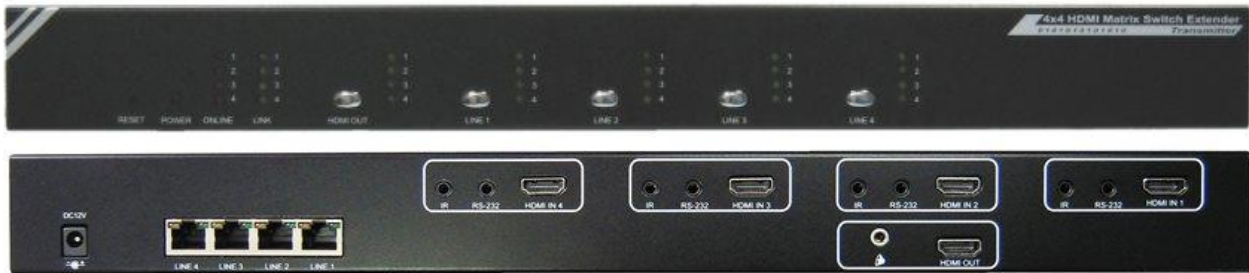
HME-44A マトリックススイッチ 前面と背面