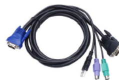
Combo Free 4 in 1 ケーブル