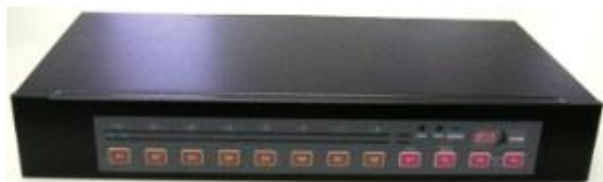
8x8 VGA スイッチ前面