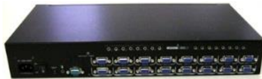
8x8 VGA スイッチ背面